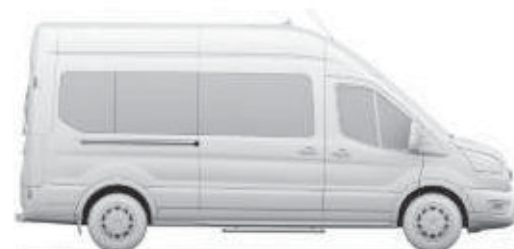
L3 H3, 14+1 säten, 11+1 säten och stort bagageutrymme