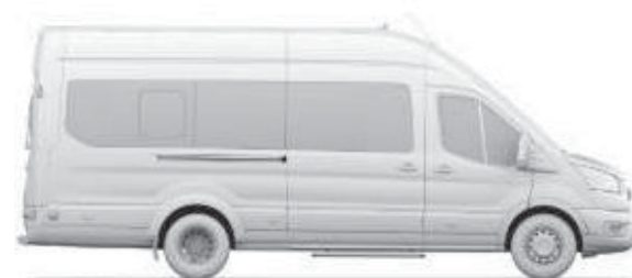
L4 H3, 17+1 säten, 14+1 säten och stort bagageutrymme