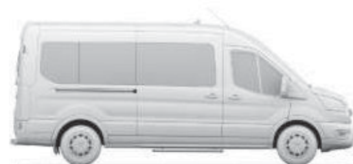
L3 H2, 14+1 säten, 11+1 säten och stort bagageutrymme